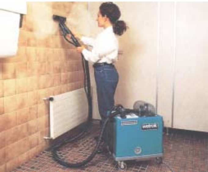
Grundlig rengöring av väggar och kakel.