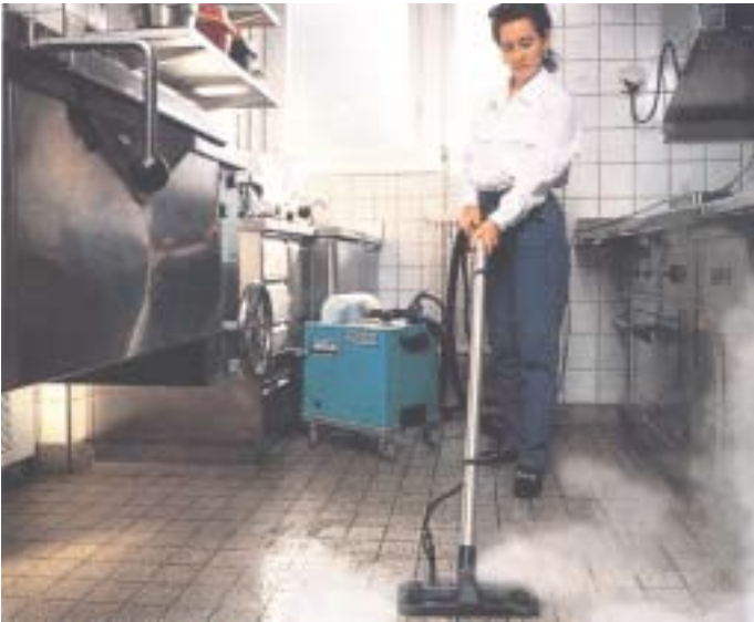
Rengöring av fet smuts i kök.