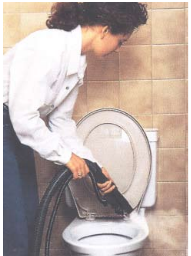
Hygienisk rengöring av toalett.